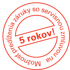
Kompletné informácie o 5 ročnej záruke obsahuje servisná zmluva, ktorá je súčasťou dodávky kondenzačného kotla

Nástenný plynový kondenzačný kotol Vitodens 111-W sa ideálne hodí do bytov alebo rodinných domov. Bez problémov sa dá namontovať na stenu do kútov kúpeľní alebo tiež komôr. Vitodens 111-W nájde svoje miesto tiež nad pracovnou linkou, práčkou alebo sušičkou. Pre niekoho, kto si potrpí na šetrnosť a dlhú životnosť, pripadá ako materiál do úvahy Ilen ušľachtilá nehrdzavejúca oceľ. Preto je tiež kotol Vitodens 111-W vybavený výhrevnou plochou Inox-Radial z ušľachtilej nehrdzavejúcej ocele, ktorá ponúka potrebnú spoľahlivosť a zaručuje trvalo vysoký stupeň využitia spalného tepla.